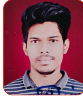
Pawan Deshbhratar History